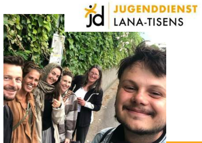
Wir beim Besuch beim JD Lana- Tisens

Es gab ein ganz besonderes Treffen auf eine besondere Art und Weise: Der Jugenddienst Brixen besuchte den Jugenddienst Lana-Tisens. Wir wurden eingeladen, um uns auszutauschen, uns besser kennenzulernen und unsere Tätigkeiten gegenseitig vorzustellen. Anschließend wurden wir zu einem gemeinsamen Mittagessen eingeladen.