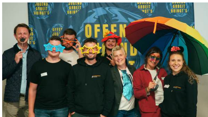
OJA bringt's Veranstaltung im Astra

Im September fand ein großes Treffen für alle Gemeindepolitiker:innen im Astra statt, bei dem Bürgermeister:innen und Jugendgemeindefert/innen einen näheren Einblick in die Offene Jugendarbeit erhalten haben.