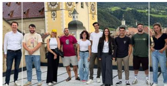
der Jugendbeirat Brixen seit 2025

Weitere Informationen findet man online beim Jugendbeirat Brixen.