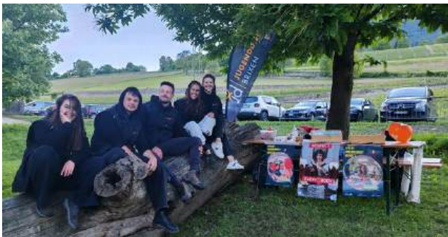
unser "chill out zone"

Im Rahmen eines Projekts waren wir einen Tag lang auf der Tschitschoheide von 7:00 bis 13:00 Uhr vor Ort. Dabei haben wir eine Chillout-Zone eingerichtet, in der sich Jugendliche von der Feier ausruhen konnten. Es gab Decken, alkoholfreie Getränke sowie einen Informationsstand, besonders für minderjährige Jugendliche.