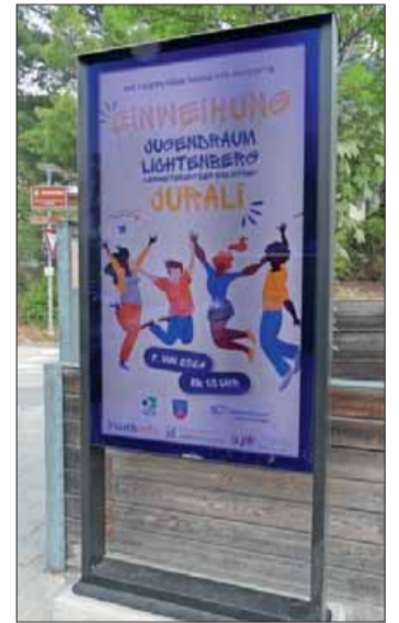
Der neue Informations-Bildschirm am Bahnhof Mals.

Die Einbindung von Jugendlichen kann im Übrigen auf vielerlei Weise erfolgen. Die Schattenwahlen parallel zur Gemeinde-