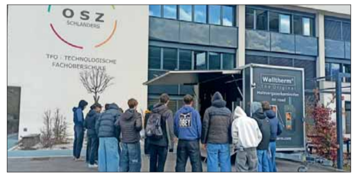
Der Eingangsbereich der TFO in Schlanders.

Die Inhalte wurden von den Lehrpersonen vorbereitet und durch zahlreiche externe Fachkräfte aus Wirtschaft und Wissenschaft ergänzt, wird in einer Aussendung erklärt. Themenbereiche waren dabei Lebensmittel samt fairem Handel und bewusstem Konsum. Es gab auch Informationen über verschiedene Bereiche des Essens wie Innovationen im Lebensmittelbereich und Lebensmittelzusatzstoffe. Ein weiteres Thema waren (erneuerbare) Energiequellen mit z. B. den Inhalten