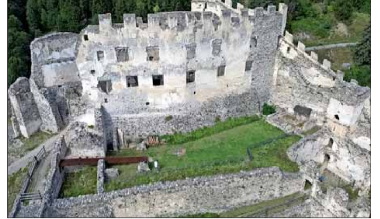
Beeindruckend und von weitem sichtbar: Die Schlossruine Lichtenberg oberhalb der gleichnamigen Ortschaft.