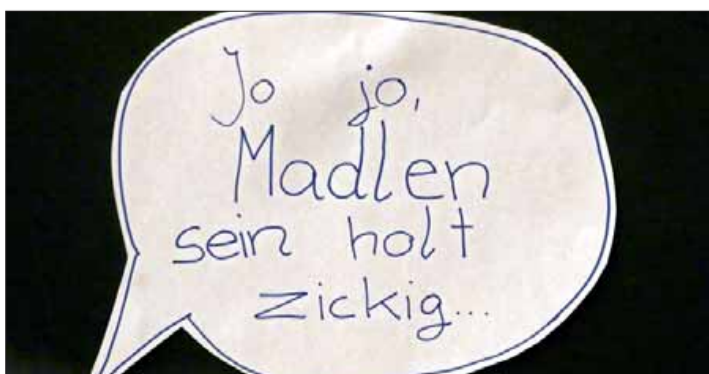
Wie sollen sich Mädchen frei entwickeln können, wenn sie laufend mit Vorurteilen konfrontiert werden? lie