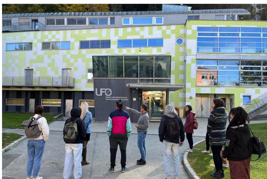
Besichtigung Jugend- und Kulturzentrum UFO in Bruneck