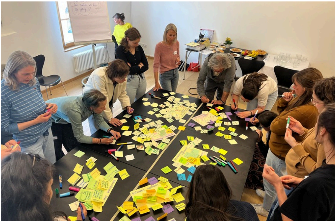
Gemeinsame Denkwerkstatt bei der Teamklausur

2025 war damit kein Jahr bloßer Verwaltung, sondern ein Jahr bewusster Entwicklung . Team und Vorstand haben daran gearbeitet, eine gemeinsame Basis zu schärfen, Abläufe zu ordnen und Voraussetzungen dafür zu schaffen, dass Jugendarbeit in den Gemeinden verlässlich, anschlussfähig und zukunftsorientiert gestaltet werden kann. Gerade darin liegt die besondere Qualität dieses Jahres. Viele Entscheidungen und Prozesse waren auf den ersten Blick unspektakulär, bilden aber das Fundament für alles, was in den kommenden Jahren sichtbar und wirksam werden soll.