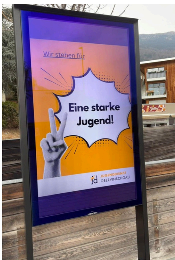
Youth-Info-Screen am Bahnhof Mals

Inhaltlich knüpft dieses Vorhaben an die landesweite Jugendinformation an, die junge Menschen über App, Büro und digitale Screens mit aktuellen und jugendrelevanten Informationen versorgt. Der neue Screen in Mals erweitert dieses Informationsformat nun auch in den Vinschgau hinein und unterstreicht den Anspruch des Jugenddienstes Obervinschgau, Informationsplattform für junge Menschen zu sein.