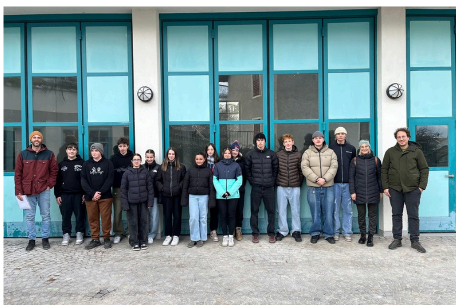
Planungstreffen mit Jugendlichen und Gemeindevertretung