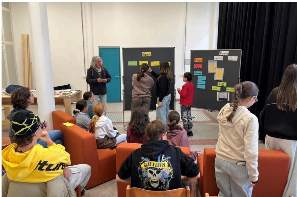
Bei einem der Planungsworkshops