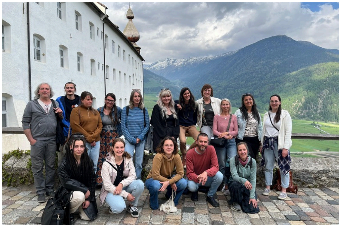
Teamklausur im Kloster Marienberg