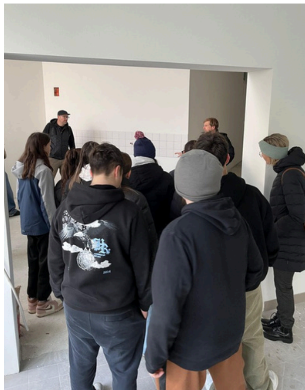
Baustellenbesichtigung im neuen Jugendraum

Gerade darin liegt die besondere Aussagekraft dieses Projekts: Es zeigt, dass Mitbestimmung, Eigenverantwortung und echte Beteiligung auch dort gelingen können, wo kein klassischer Trägerverein mehr vorhanden ist.